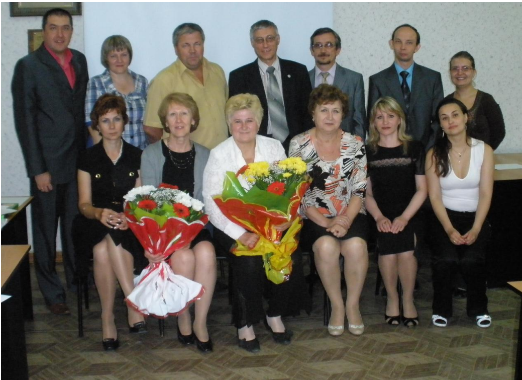
Выпуск политологов и ГАК, 2011 г.