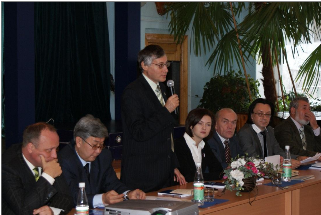
На Всероссийской политологической конференции «Проблемы социальной и административной консолидации Байкальской Сибири», 2008 г.