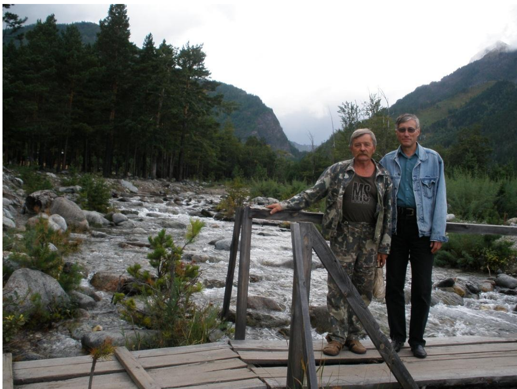
Аршан, не проходящая любовь – Сибирская природа, 2009 г.