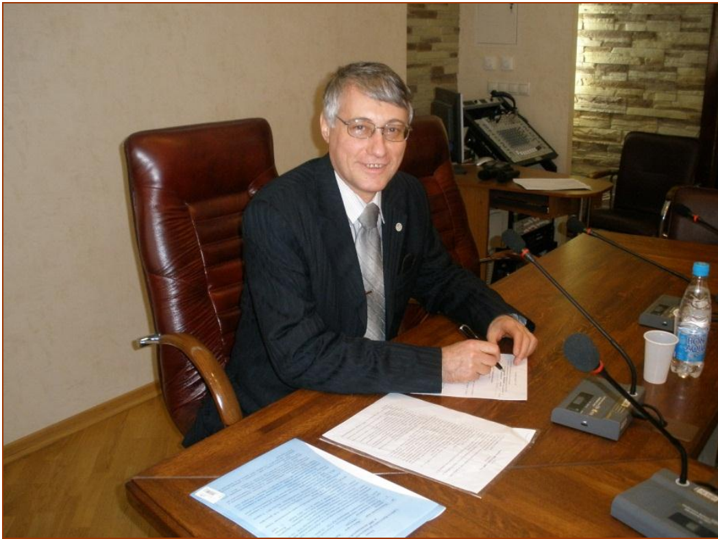
На конференции в зале заседаний Ученого совета ИГУ, 2012 г.