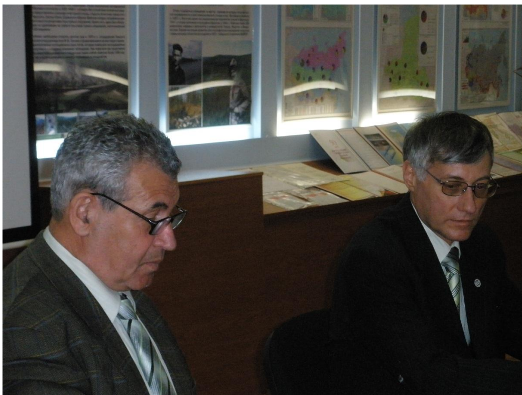
На заседании ВСОРГО, 2010 г.