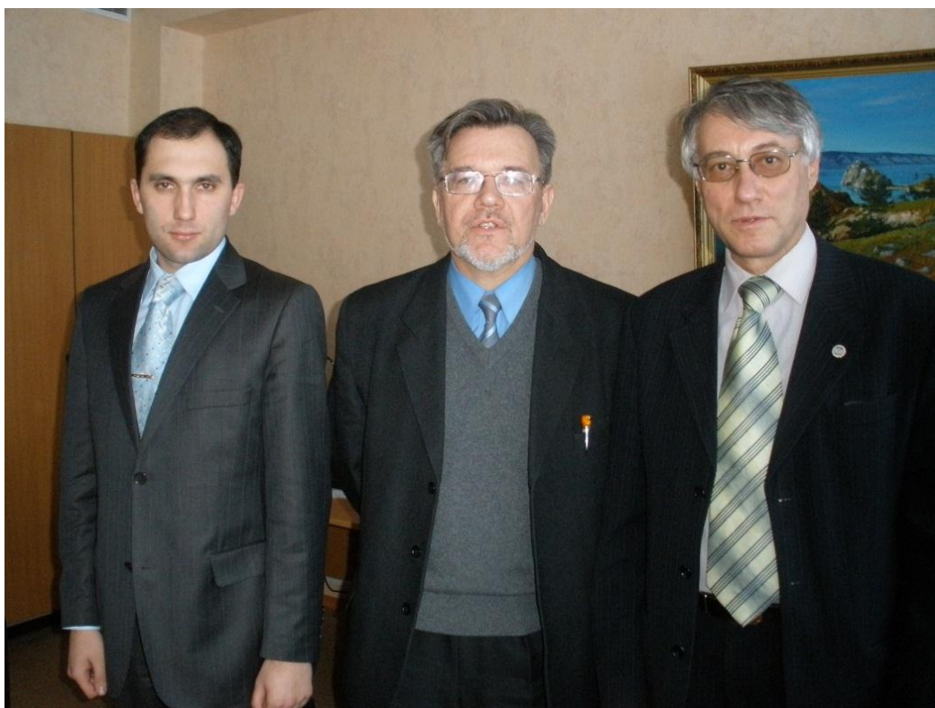
На научном семинаре, 2010 г.