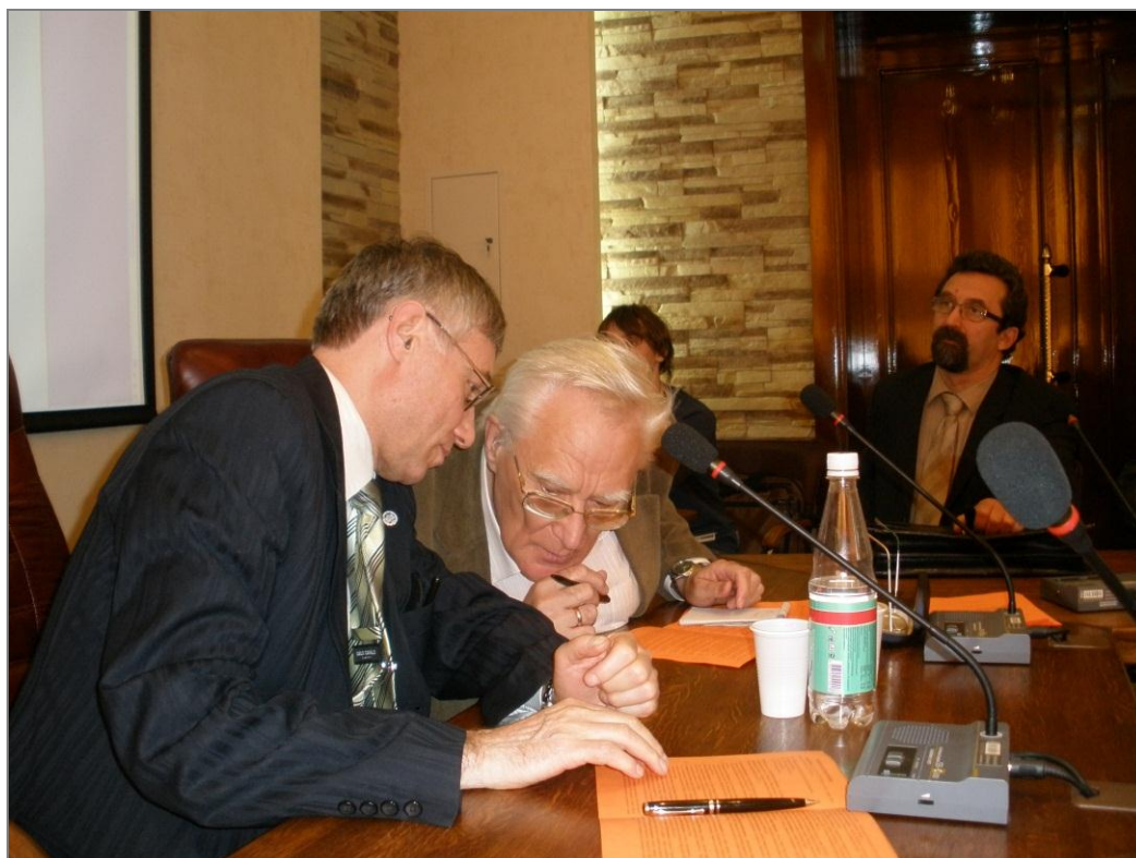
На политологической конференции «Регион в стране и мире – тенденции и динамика политического развития», 2006 г.