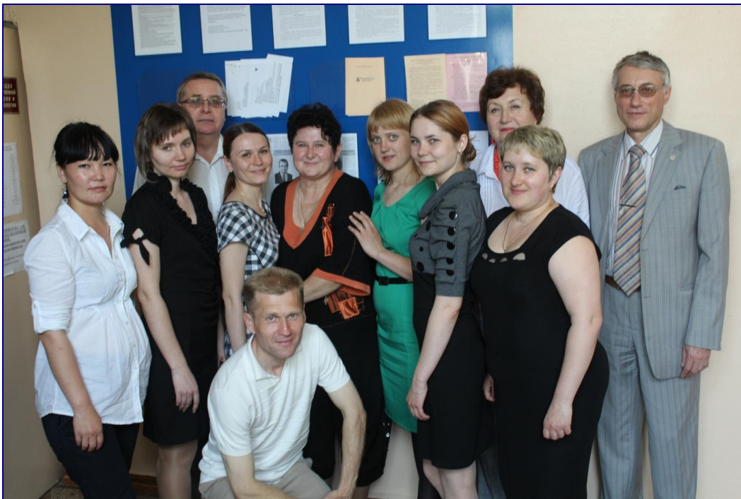
Выпуск политологов, 2012 г.