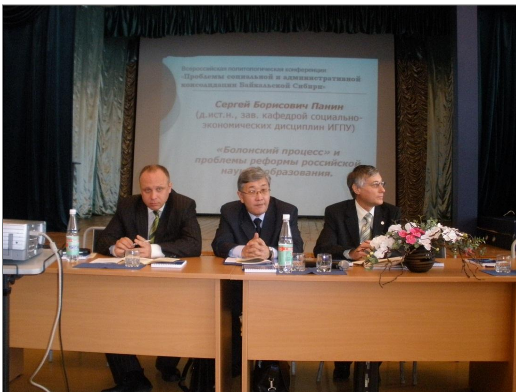
Коллеги-политологи, 2008 г.