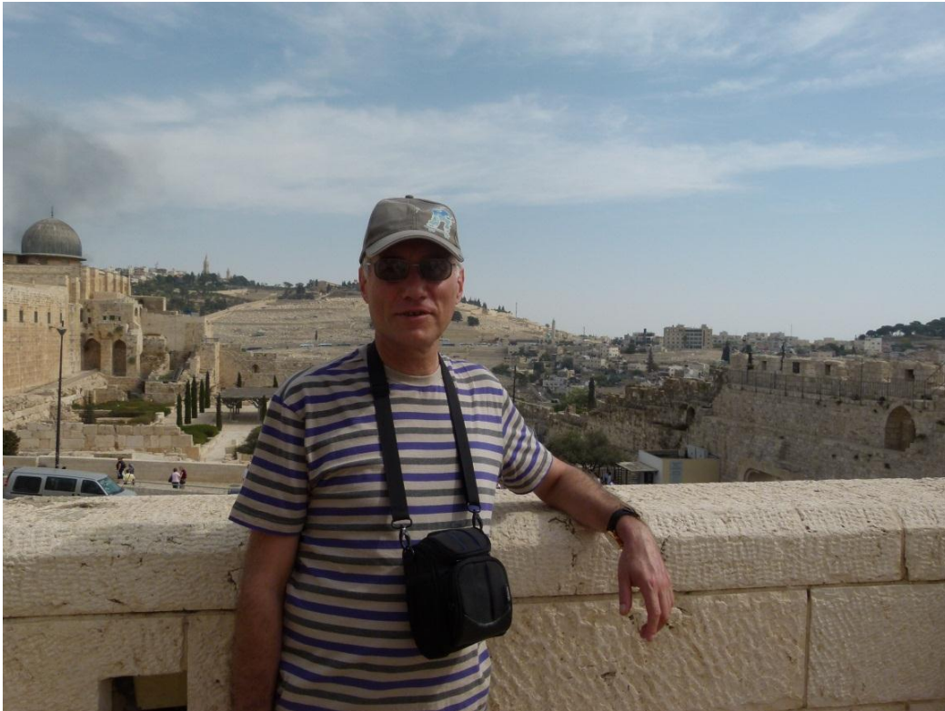
Иерусалим – Священная земля, 2011 г.