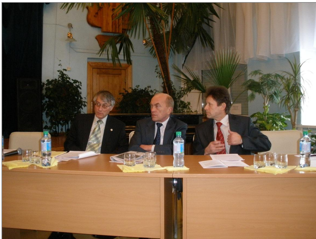
В президиуме конференции, 2007 г.