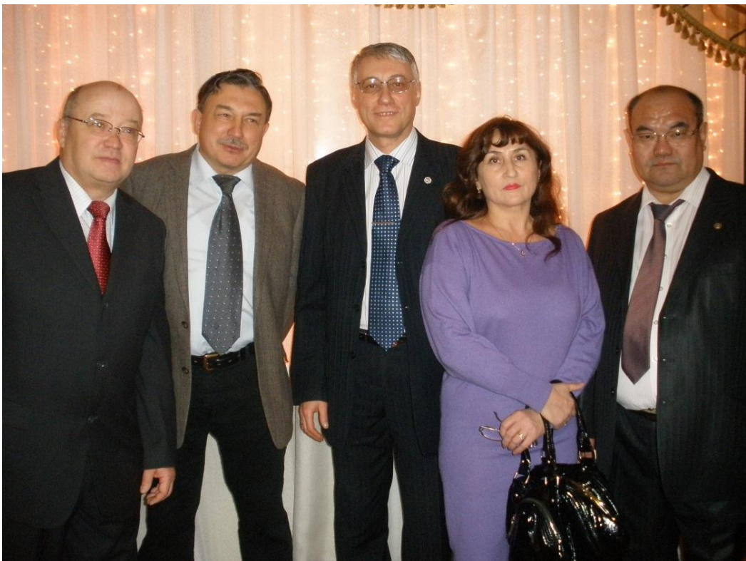
С коллегами историками с супругой, 2011 г.