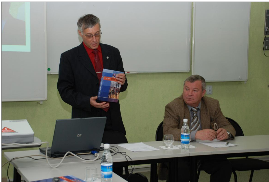
На презентации учебника «Политология», 2008 г.