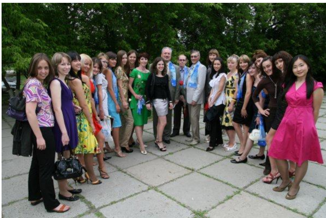
Выпуск рекламистов факультета сервиса и рекламы, 2010 г.