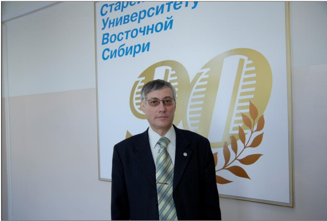
В годовщину юбилея ИГУ, 2008 г.