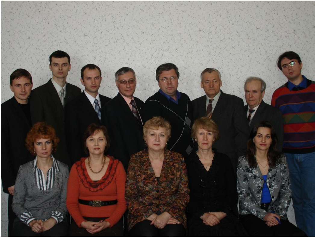
Коллектив кафедры политологии и отечественной истории ИГУ, 2010 г.